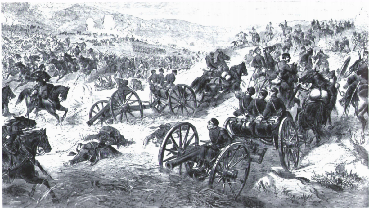
Sächsische Artillerie auf dem Vormarsch.